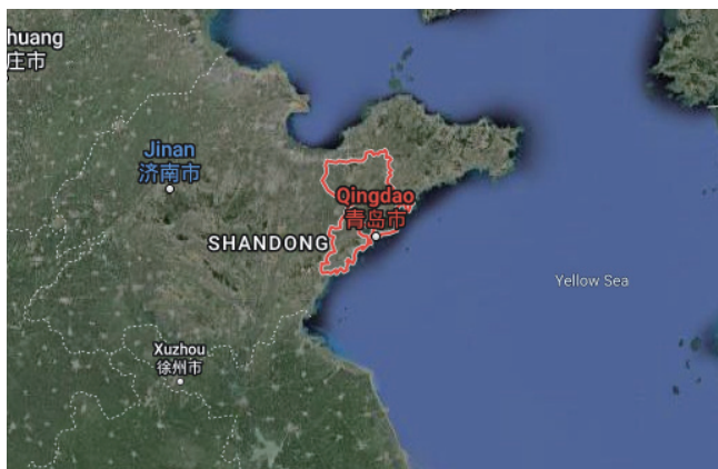
图1 山东省青岛市地理位置图

2022年，晶科能源全面开启“N型时代”，其中Tiger Neo具备更高收益、更低成本等多重优势，相比P型，N型组件同样面积组件发电量增加5-6%，正逐步成为光伏大基地、大型地面电站、户用、工商业等项目首选，引领光伏选型方案高质量升级。