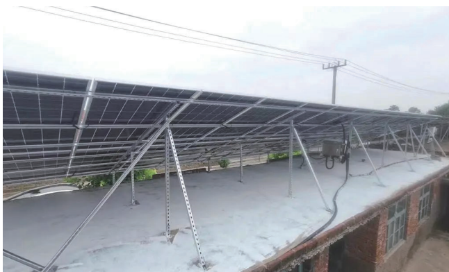
图2 青岛实证项目照片

由此得出TOPCon和PERC双面光伏组件的单瓦发电量增益，并系统的进行了比较。